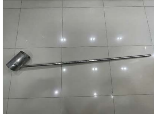
กระบอกลูกเก็บตัวอย่างน้ำ