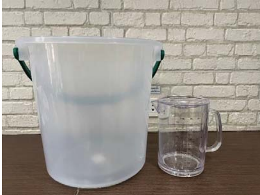
ถังเก็บตัวอย่างน้ำ